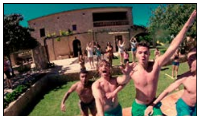
Lange nicht genug