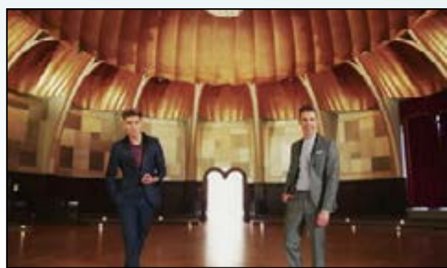
Du bringst mich um (den Verstand)