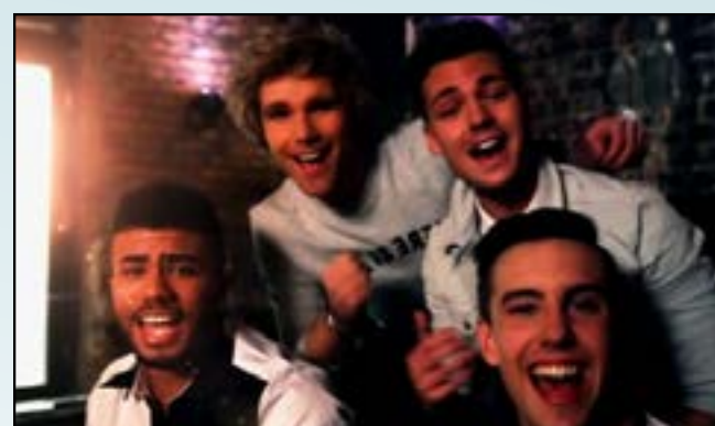
Verdammt guter Tag