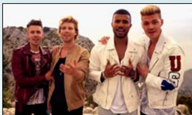
Ein Lied auf das Leben