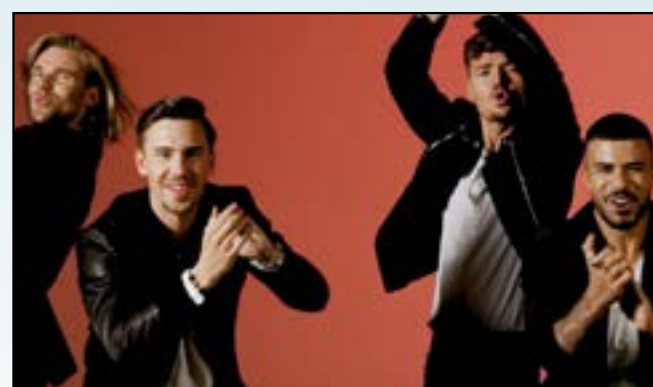
In meinen Träumen ist die Hölle los